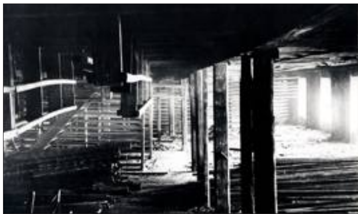
Les sous-sols où étaient entreposées les tuiles pour les faire sécher.