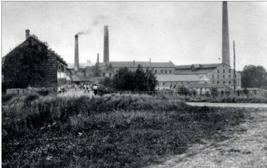
L'usine telle qu'elle existait vers 1900 (vue depuis Retzwiller). À gauche, les maisons de la cité ouvrière qui existent encore aujourd'hui.