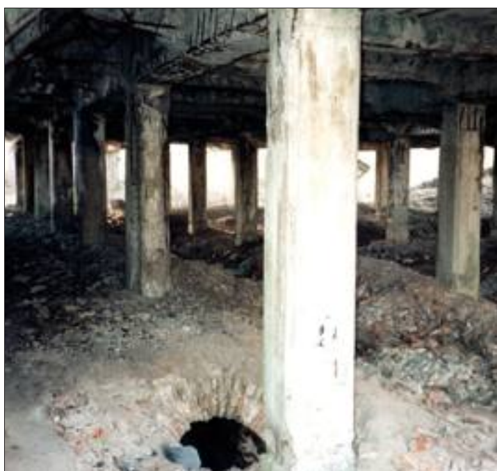
Les sous-sols de l'usine où se trouvaient les fours tels qu'ils se présentaient avant la destruction de la friche.