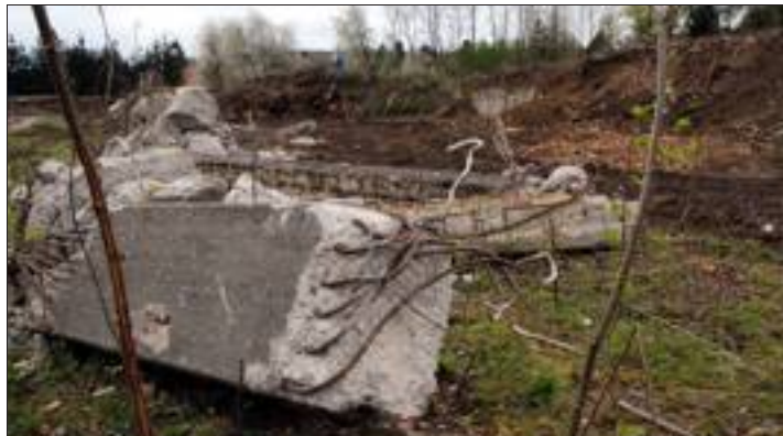
Les piliers de soutènement après le passage des bulldozers.