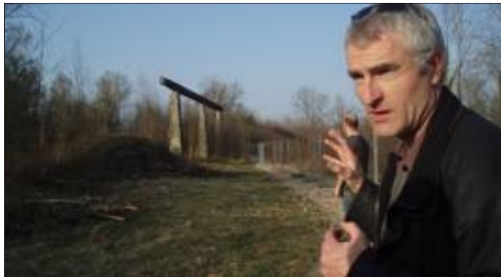
La friche Gilardoni avant les travaux de démolition (ici avec le maire de Wolfersdorf). Au fond, les trois piliers qui soutenaient l'extension de l'usine.