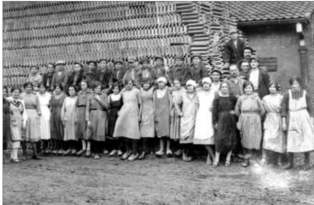
Les ouvriers, parfois très jeunes, devant l'usine de Wolfersdorf.