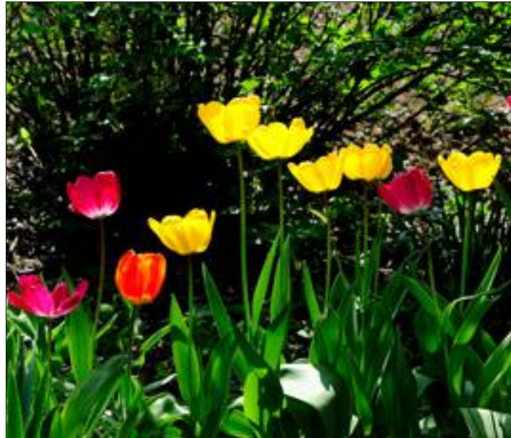
Actuellement, les tulipes égaient les jardins de nos villages.