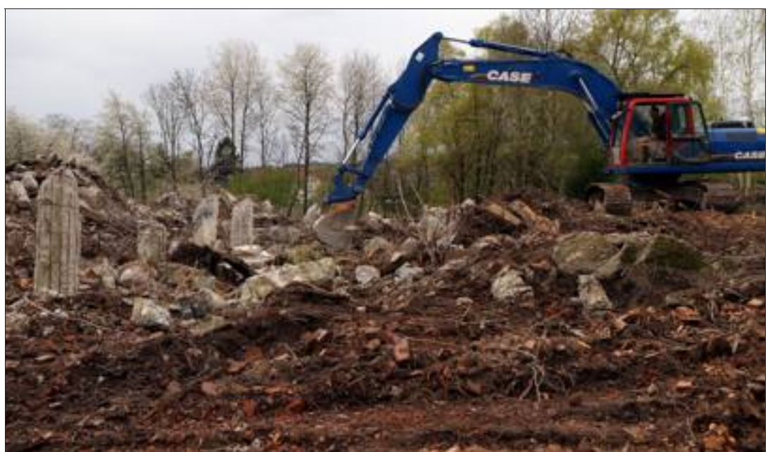
D'ici un mois, il ne restera plus rien de l'usine Gilardoni de Wolfersdorf.

Un projet remis à plus tard pour des raisons financières. « Pour l'instant il sera simplement remis en prés, il n'y a pas de projet », précise-t-il.