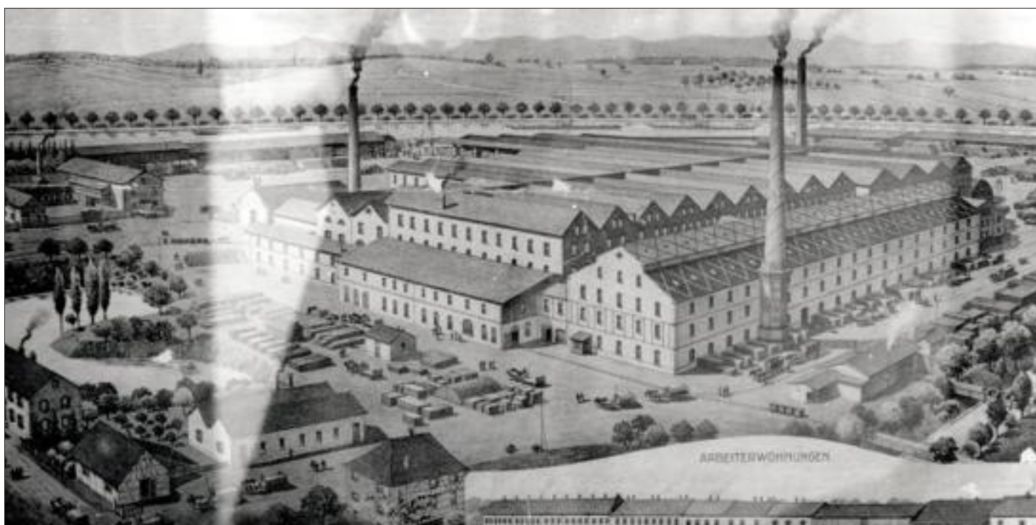
Une représentation de l'usine de fabrication de tuiles Gilardoni de Wolfersdorf vers 1900.