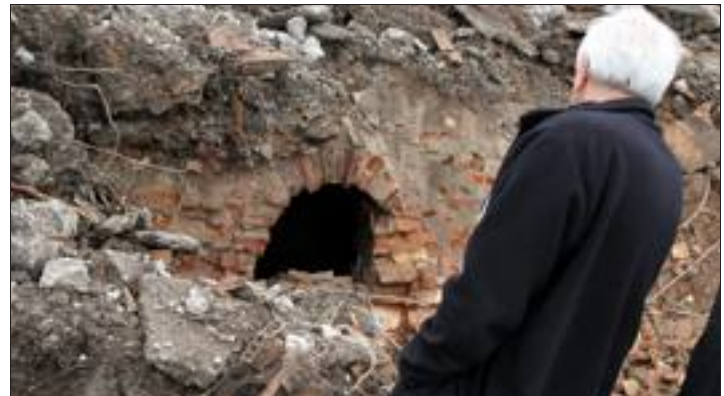
Les vestiges d'un four sont apparus sous la montagne de terre et de gravats.