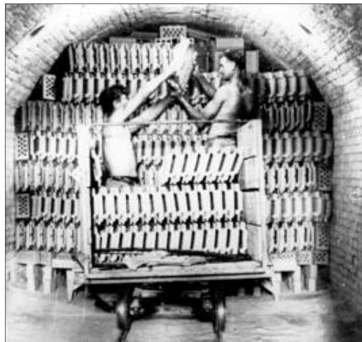
Les enfourneurs disposaient les tuiles dans les fours. Un des postes les plus difficiles.

Une épopée qui a débuté au milieu du XVIII e siècle, à quelques kilomètres de là. C'est en effet à Altkirch que les frères Gilardoni, Thiébaud et François, soucieux de diversifier l'activité de leur beau-père, fabricant de faïence, ont créé la première usine en 1835 sur le site de l'actuelle école des Tuileries.